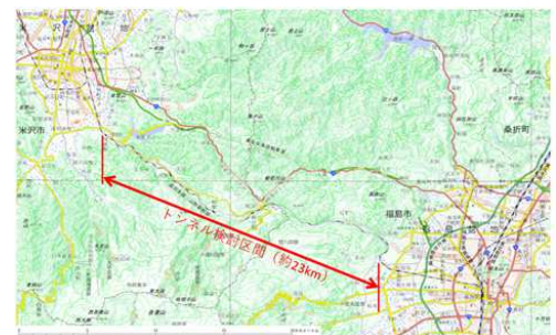
【計画範囲図】電子地形図1/20万（国土地理院）